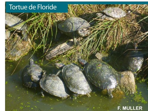
Tortue de Floride

Suite à l'adoption d'un règlement européen, en 2013 , une stratégie nationale et régionale est en cours d'élaboration, dont l'objectif est de limiter l'impact des EEE* .